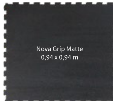
Nova Grip Matte 0,94 x 0,94 m