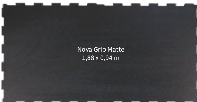
Nova Grip Matte 1,88 x 0,94 m

Zwei Größen zur Auswahl - können miteinander kombiniert werden.