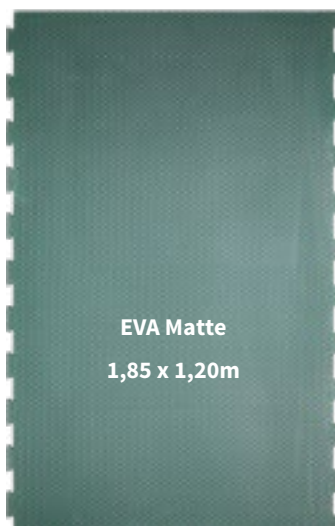
EVA Matte 1,85 x 1,20m

EVA-Matten sind in zwei Größen erhältlich.