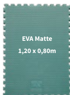
EVA Matte 1,20 x 0,80m

EVA-Matten sind in zwei Größen erhältlich.