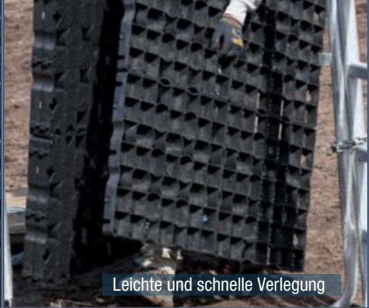
Leichte und schnelle Verlegung