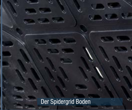
Der Spidergrid Boden