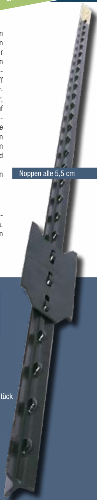
Noppen alle 5,5 cm

Wir empfehlen einen Pfostenabstand bei Elektroseilen von ca. 5 - 6 m und bei Bändern einen Abstand von ca. 3 - 5 m.