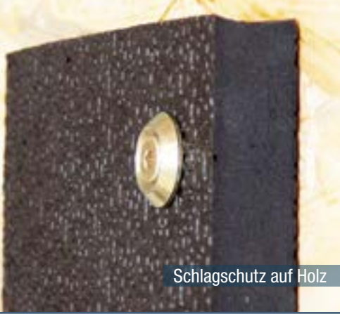
Schlagschutz auf Holz