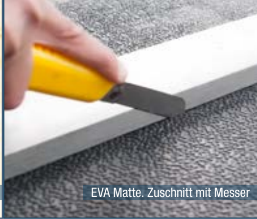
EVA Matte. Zuschnitt mit Messer