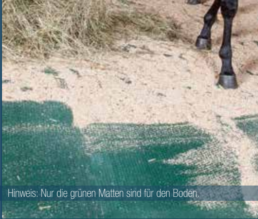
Hinweis: Nur die grünen Matten sind für den Boden.