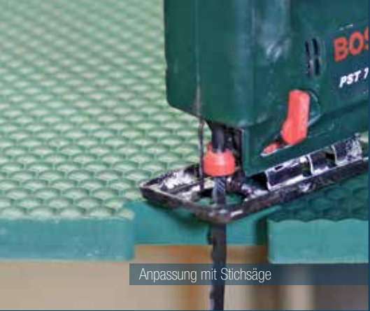
Anpassung mit Stichsäge