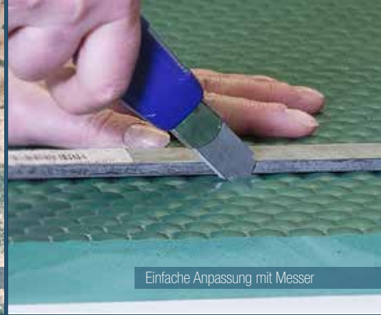
Einfache Anpassung mit Messer