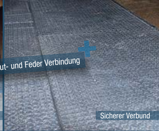
Nut- und Feder Verbindung