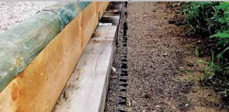
Praktisch mit hervorragender Wasserführung: Der Oben-Aufbau

Von dem links beschriebenen Minimalunterbau können Varianten ausgeführt werden. Zum Beispiel ein Aufbau mit Vlies und einer dünnen Drainschicht. Hier wird vor dem Aufbringen der Schotterschicht ein Vlies auf den gewachsenen, vorbereiteten Untergrund gelegt. Dadurch wird vermieden, dass sich der Schotter beim Walzen oder Rütteln in den weichen Boden eindrückt. Zusätzlich erhöht das Vlies die Stabilität des Aufbaus. Je nach vorhandenem Untergrund kann der Unterbau noch weiter reduziert werden. Bei dem Pro Grid® Evolution mit der integrierten Querentwässerung ist auch eine Verlegung direkt auf den Boden durchführbar. Weitere Kombinationen sind denkbar, z.B. Boden-Vlies-Gitter oder Boden-Vlies-Splitt-Gitter. Diese minimalsten Unterbauten, sind jedoch, unabhängig von Gewicht und Stärke der Gitter, mit Einschränkungen bzgl. der dauerhaften Funktionsfähigkeit der Fläche verbunden. Wir beraten Sie gern.