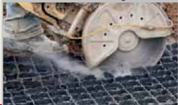
Zuschnitt mit Handkreissäge