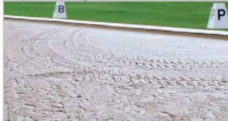
Die optische Premium-Lösung: Der Unten-Einbau

Ob bei Reitplatz, Paddock, Offenstall oder Auslauf, der Aufbau der Fläche auf dem bestehenden Boden-Niveau erspart die Kosten für den Erdaushub. Dadurch ist der Oben-Aufbau besonders leicht in Eigenleistung zu realisieren. Der gewachsene Boden wird mit einem Gefälle von 1,5 - 3% vorbereitet (sh. Verlegeanleitung). Ein vorheriges Abschieben mit schweren Maschinen findet nicht statt. Der weitere Aufbau erfolgt wie in der Verlegeanleitung beschrieben. Eine Einfassung für das Pro Grid® wird nicht benötigt, die Einfassung für den Unterbau und ggf. die Tretschicht kann auf dem Gitter befestigt werden. Diese Bauweise zeichnet sich durch eine hervorragende Ableitung von überschüssigem Wasser aus. In der Regel ist bei diesem Aufbau eine zusätzliche Verlegung von Drainagerohren nicht nötig. Das Wasser fließt seitlich aus der Fläche ab.