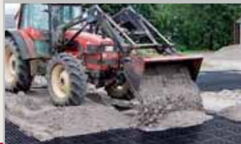
Verfüllen mit Traktor