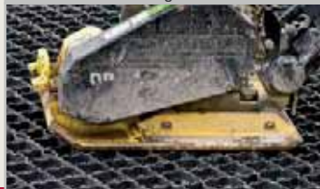
Einrütteln der verlegten Gitter